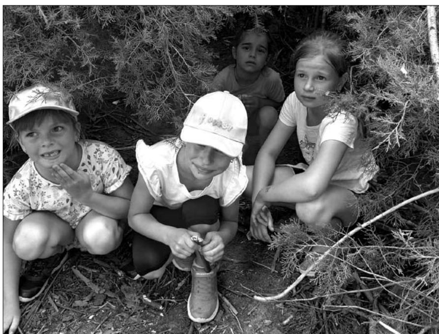
A szentkirályi iskolások az Arborétumban töltötték az idei gyereknapot.