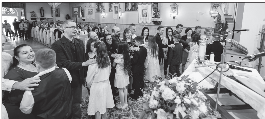
A szülői áldás